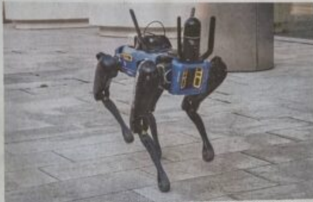
Roboterhund „Spot“ soll mit seinem aufmontierten Laserscanner die Umgebung erkunden

Im Wiener Büro der Forschungseinrichtung VRVis will man dem Roboter hingegen eine nützliche Aufgabe übertragen. Er soll zukünftig Baustellen abgehen und scannen können. So soll eine komplette Dokumentation des Bauprozesses entstehen. Momentan wird das händisch gemacht. „Wöchentlich nimmt man 360-Grad-Fotos auf, die sich dann niemand anschaut“, erklärt Thomas Ort-